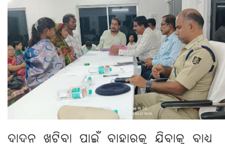
ବାଦନ ଖରିବା ପାଇଁ ବାହାରକୁ ଯିବାକୁ ବାଧ୍ୟ ହେଉଥିବାର କଥା ଜଣାଇଛନ୍ତି । ଅତିରିକ୍ତ କିଲ୍ଲାପାଳ

ନଥିବା ବେଳେ କିଛି ଗ୍ରାମକୁ ବିଦ୍ୟୁତ୍ ଲାଭନ ସଂଯୋଗ ହୋଇନାହିଁ । ସେହିପରି ପିଇବା ପାଣିର ସମସ୍ୟା ମଧ୍ୟ ଅନେକ ଗୁଡ଼ିଏ ଗ୍ରାମରେ ପରିଲକ୍ଷିତ ହେଉଛି । ଛାତ୍ର ଛାତ୍ରୀଙ୍କୁ ହସ୍ତକ୍ଷେପ ସିଟ୍ ମିଳୁନଥିବା ଯୋଗୁଁ ବହୁ ପିଲା ପାଠପଢ଼ି ପାରୁ ନାହାଁନ୍ତି । ସାମାଜିକ ସୁରକ୍ଷା ଓ ଖାଦ୍ୟ ସୁରକ୍ଷାରୁ ମଧ୍ୟ ବହୁ ଲୋକ ବଂଚିତ ଥିବାର ଦୃଶ୍ୟ ଦେଖିବାକୁ ମିଳୁଛି ବୋଲି ସେମାନେ କହିଛନ୍ତି । କିଛି ଲୋକ ଛୁମ୍ପିହାନ ଥିବା ଯୋଗୁଁ ଆବାସ ଯୋଜନାରେ ପର ପାଇପାରୁ ନାହାଁନ୍ତି । କାମ ମିଳୁନଥିବାରୁ ଲୋକେ